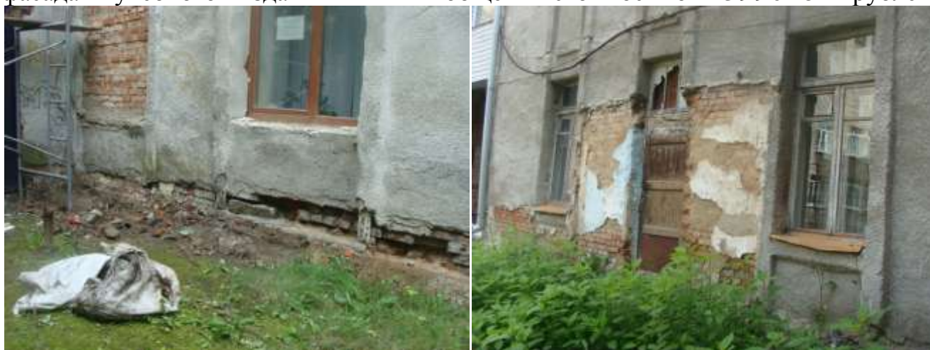
Фото до ремонта.

3. В июле 2017 года выполнены работы по капитальному ремонту отмостки и фасада учебного здания «А» общей стоимостью 399018 рублей.