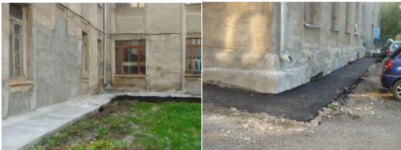
Фото после ремонта.