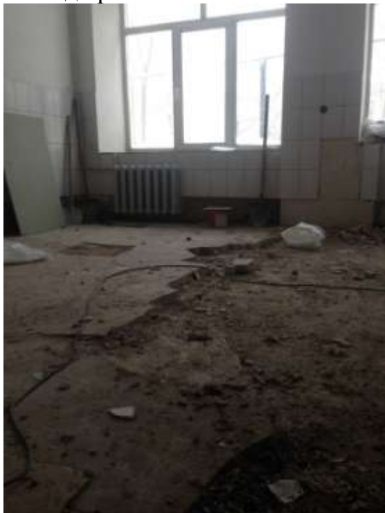
Фото до ремонта: