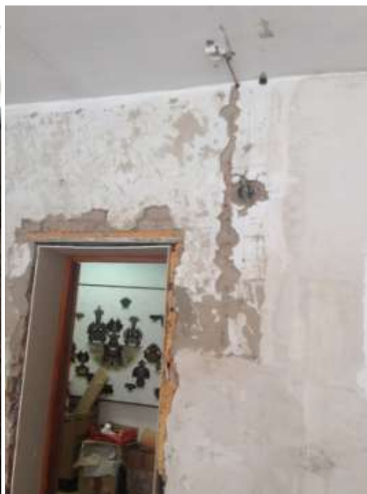
Фото после ремонта: