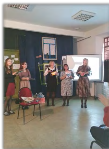
Посвящение первокурсников в студенты